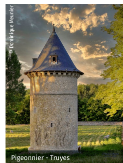
Pigeonnier - Truyes