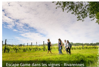
Escape Game dans les vignes - Rivarennès