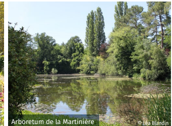
Arboretum de la Martinière