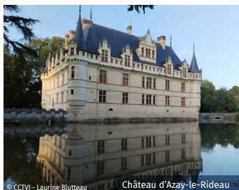
Château d'Azay-le-Rideau

.....Une diversité de richesses patrimoniales, culturelles et d'activités de loisirs