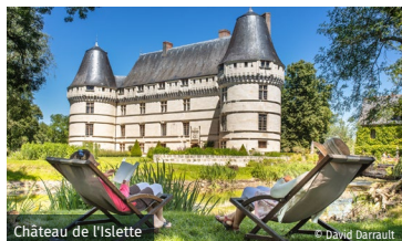
Château de l'Islette