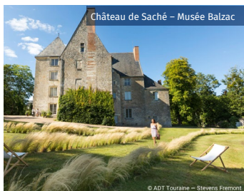
Château de Saché - Musée Balzac

Les châteaux d'Azay-le-Rideau, d'Ussé, de l'Islette, la Forteresse de Montbazou, ou encore le Domaine de Candé