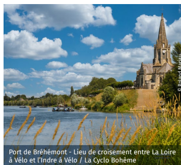
Port de Bréhémont - Lieu de croisement entre La Loire à Vélo et l'Indre à Vélo / La Cyclo Bohème