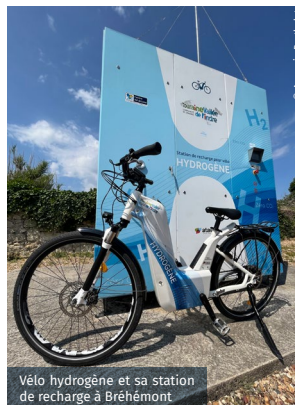
Vélo hydrogène et sa station de recharge à Bréhémont