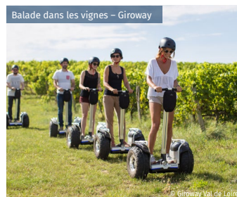
Balade dans les vignes - Giroway

Family Park et la Vallée Troglodytique des Goupillières Piscines / karting / mini-golfs