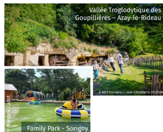
Vallée Troglodytique des Goupillières - Azay-le-Rideau

La Cité rétro-mécanique Maurice Dufresne, l'Espace Culturel Osier Vannerie, le Musée Balzac et le Musée de la Poire Tapée