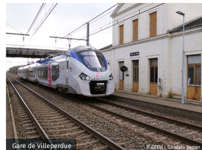
Gare de Villeperdue