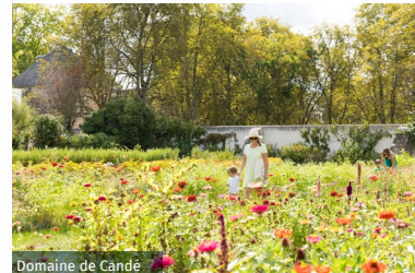
Domaine de Candé